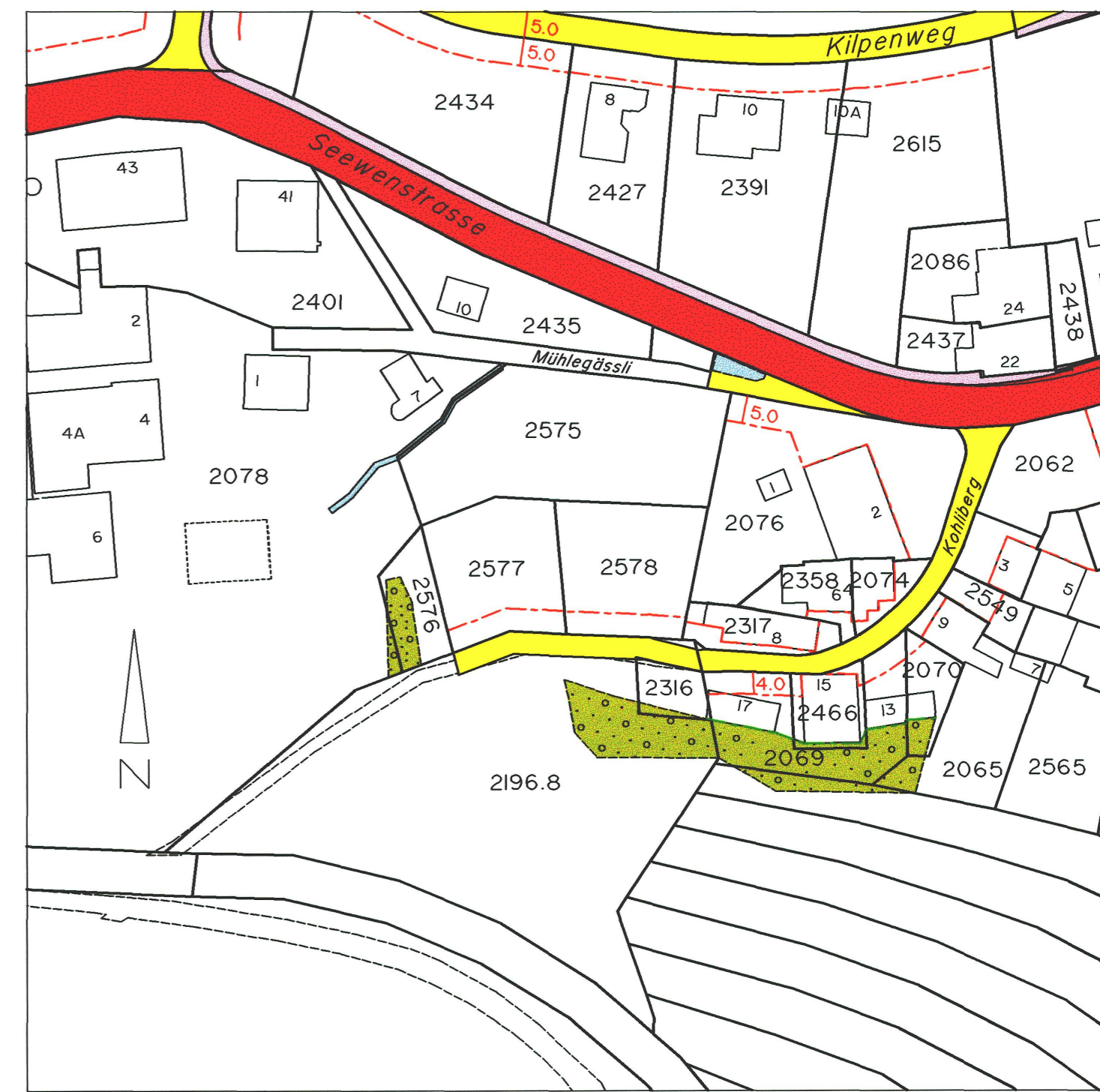
geänderter Erschliessungs- und Strassenlinienplan RRB Nr. 2366 / ..... vom 23.II.04 / .....