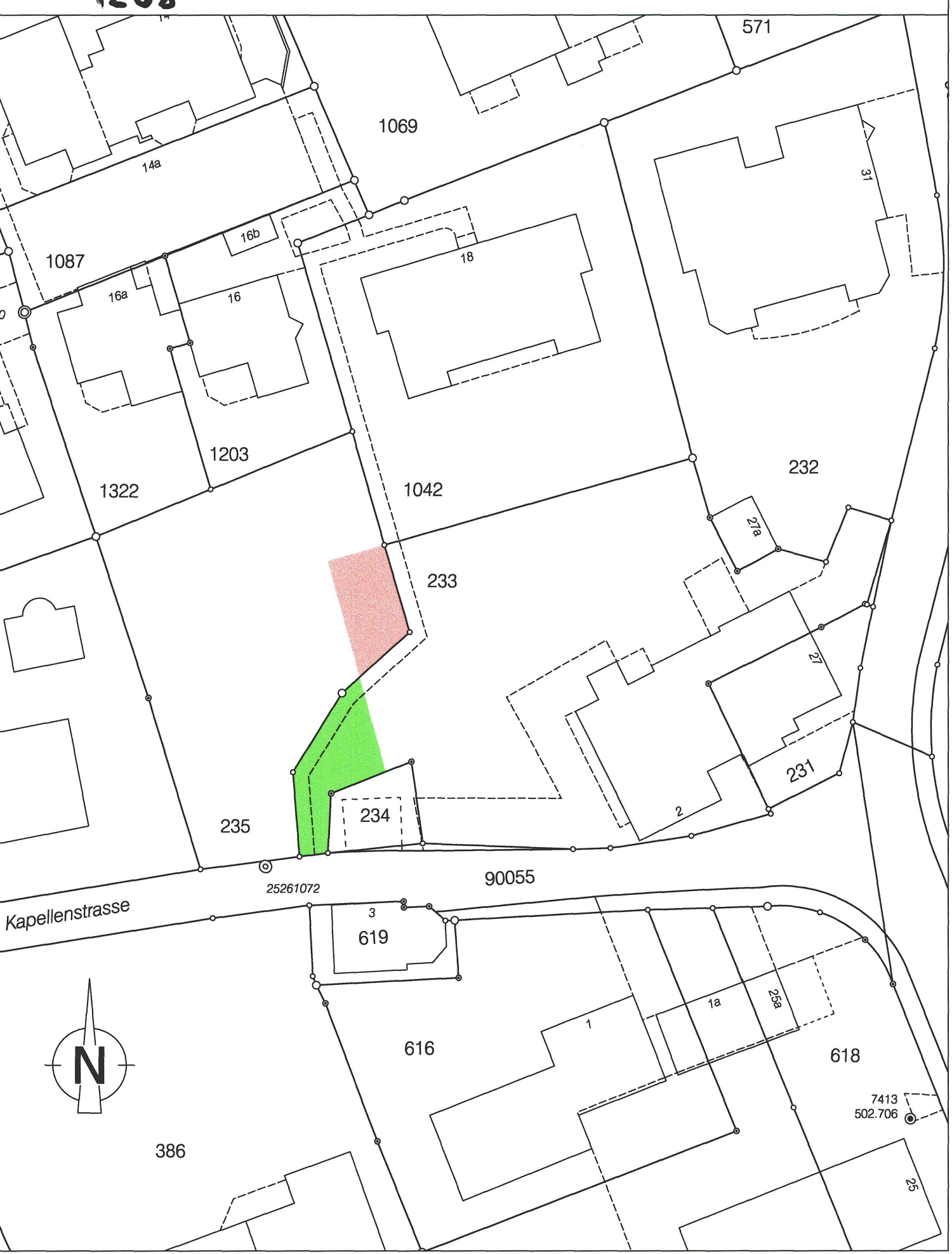
Bauzonenplan neu RRB Nr. 506 vom 25.03.2003 / RRB Nr. 1268 vom 14.6.2011 orientierend